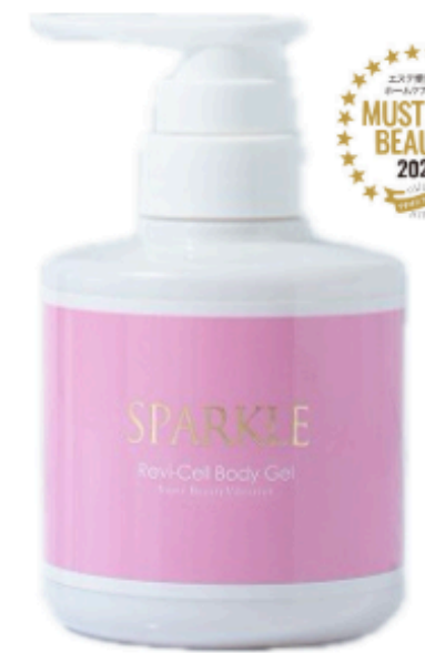
Revi-Cell bodyジェルSPARKLE 300g ¥16,500(税込)