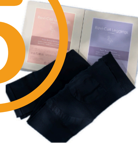
Revi-Cell bodyレギンス 1枚 ¥7,480(税込)